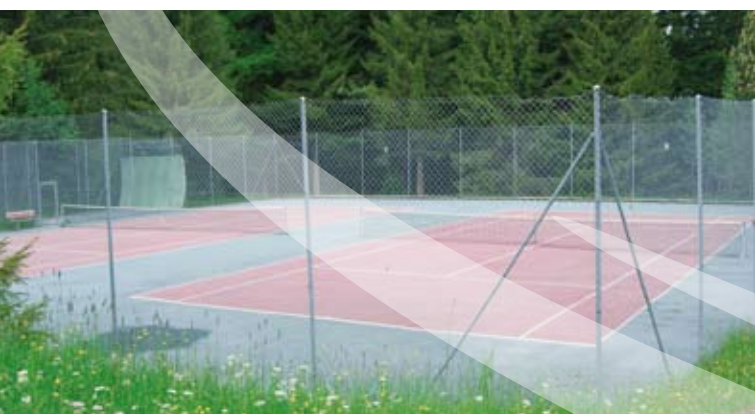
Tennisplatz – Tennisclub Eywald.