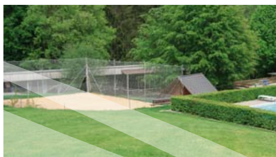
Unmittelbar neben dem Schwimmbad befindet sich das Beach-Volleyballfeld.