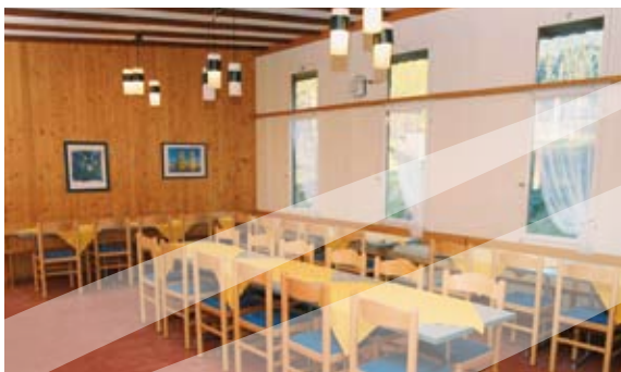
Speise und Aufenthaltsraum.