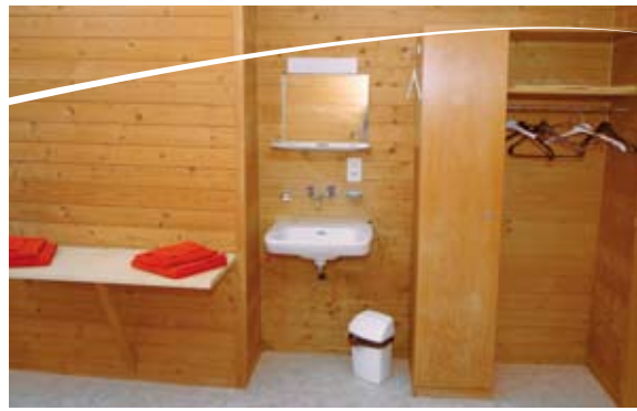
Vier heimelige Doppelzimmer mit fließend Warm- und Kaltwasser.