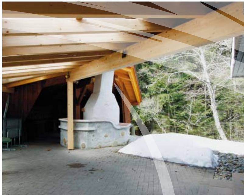
...im Sommer oder Winter...