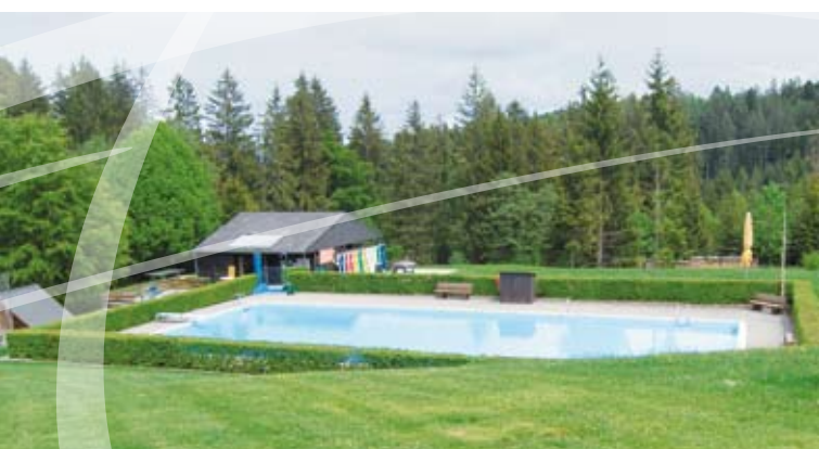
Wunderbares Schwimmbecken für Schwimmer und Nichtschwimmer.

Das Eywaldhus eignet sich besonders gut für Schul- und Skilager, Sportwochen, Tagungen, Vereine, Gruppen- sowie Familienfeiern.