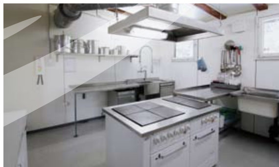
Hier können Kochkünste und Kreativitäten ausgelebt werden.