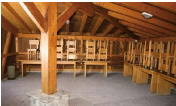
...mit genügend Sitzgelegenheiten.