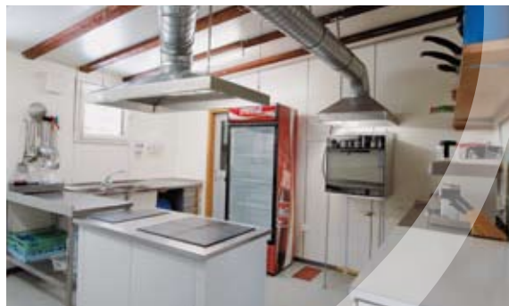
Integrierter Combi-Steamer und zwei Geschirrspüler.