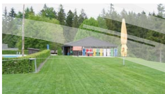
Grosse und gepflegte Liegewiese.